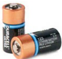
Zoll AED bruker ordinære husholdningsbatterier