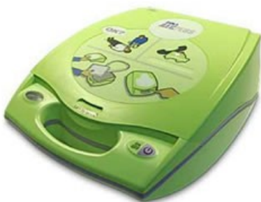
Zoll AED Plus har vannavstøtende konstruksjon