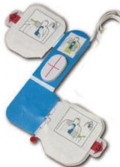
Standard elektrode med kompresjons-tilbakemelding