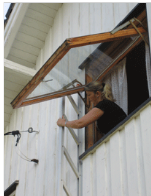
Fell ut stigen