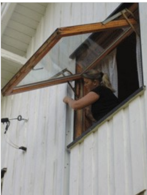
Dra ut splinten